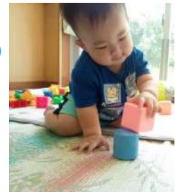
すごい! うまく できるかな?