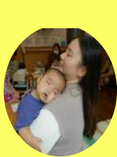
ねむたん なつきた〜♪