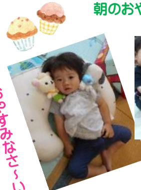
おちおちぽんぽん〜♪