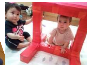
トンネル くぐりま〜す♪