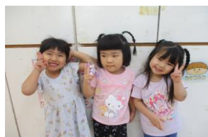
流行りの髪型です☆三