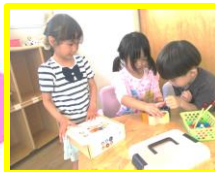
どの色にする〜? まようね〜