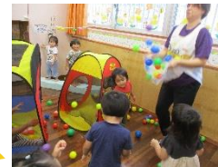
ボールを集めて~ わああ~