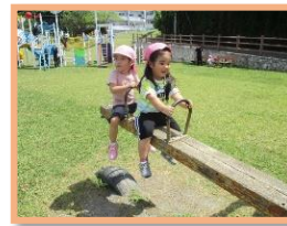
シーソー楽しいなあ~

5月17日(金)、北谷にある謝苺公園へ遊びに行ってきました。朝からワクワクな様子の子もたち、バスに乗って出発~(^^) / 着いて水筒から上手に飲み、走って遊具にレッツゴー!! たくさん遊びました。