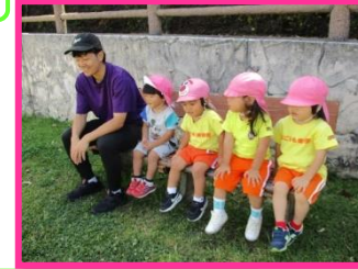
みんなで水分補給