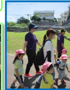
手をつないで歩こう~