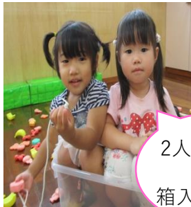
2人なかよく 箱入り娘*