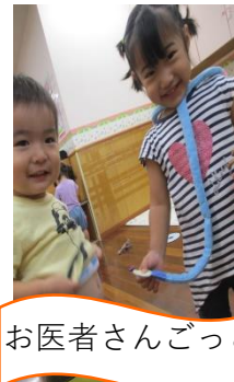
お医者さんごっこ