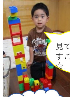
見て!見て~!! すごい出来たよ☆