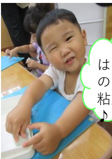
はじめての 粘土遊び