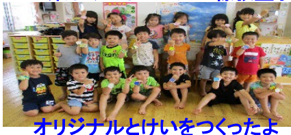
オリジナルとけいをつかったよ