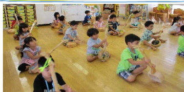
楽しみにしていた三線教室♪

気温の上昇に伴い、体温調節がうまくできずに、熱中症を発症する事があります。顔が赤い、汗をひどかく等の症状が見られた時には、水分補給やタオルで冷やす等して、体温さげましょう。