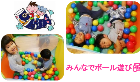
みんなでボール遊び☆

◇ クラスの様子 ◇ りす組に進級して1か月が経ちましたが、新しいお部屋、新しい先生にも慣れてきた子どもたち。新入園児の子の名前も覚えて、みんなで名前を呼び合っている様子がみられますよ(^^) 元気いっぱいで、遊びの中でオモチャの取り合いが起こることもありますが、子どもたちのケガの無いよう見守っていきたくと思ひます。