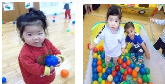
みんな大好き(≧▽≦)ボール遊び♪

新年度準備でお弁当持参(調理室メンテナンスのため)になります。また、延長保育はないので18時までにお迎えとなります。ご協力よろしくをお願いします(*^^*)