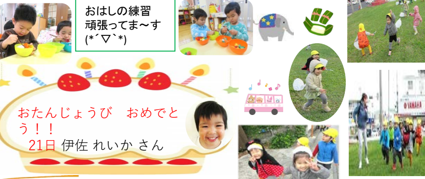
おはしの練習 頑張ってます (*´▽`*)